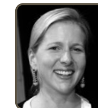
Cristina Stenbeck Kinnevik