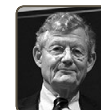
Jacob Wallenberg Investor