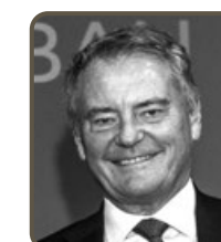
Carl-Henric Svanberg AB Volvo