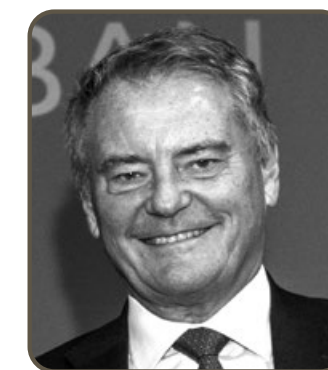
Carl-Henric Svanberg AB Volvo

Med stort engagemang har Carl-Henric Svanberg i över ett decennium axlat rollen som ordförande i AB Volvo. Styrelsen består av ledamöter med gedigen operativ erfarenhet, olika nationaliteter och bakgrunder, vilket kräver ett starkt och skickligt ordförandeskap för att få ut all kunskap och erfarenhet. Det är något som Carl-Henric har lyckats med.