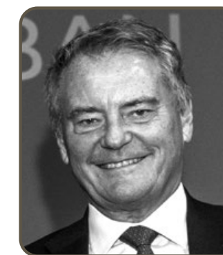
Carl-Henric Svanberg AB Volvo

Med stort engagemang har Carl-Henric Svanberg i över ett decennium axlat rollen som ordförande i AB Volvo. Styrelsen består av ledamöter med gedigen operativ erfarenhet, olika nationaliteter och bakgrunder, vilket kräver ett starkt och skickligt ordförandeskap för att få ut all kunskap och erfarenhet. Det är något som Carl-Henric har lyckats med.