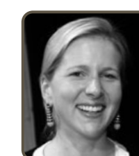
Cristina Stenbeck Kinnevik