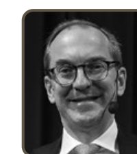
Patrik Tigerschiöld Bure Equity