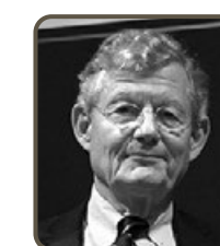
Jacob Wallenberg Investor