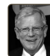
Johan Markman Atteviks Bil